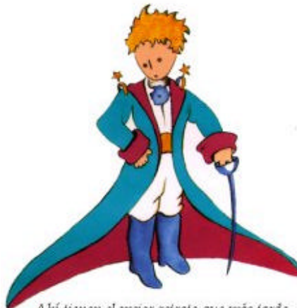
Aquí tienen el mejor retrato que más tarde logré hacer de él

Me puse en pie de un salto como herido por el rayo. Me froté los ojos. Miré a mi alrededor. Vi a un extraordinario muchachito que me miraba gravemente. Ahí tienen el mejor retrato que más tarde logré hacer de él, aunque mi dibujo, ciertamente es menos encantador que el modelo. Pero no es mía la culpa. Las personas mayores me desanimaron de mi carrera de pintor a la edad de seis años y no había aprendido a dibujar otra cosa que boas cerradas y boas abiertas.